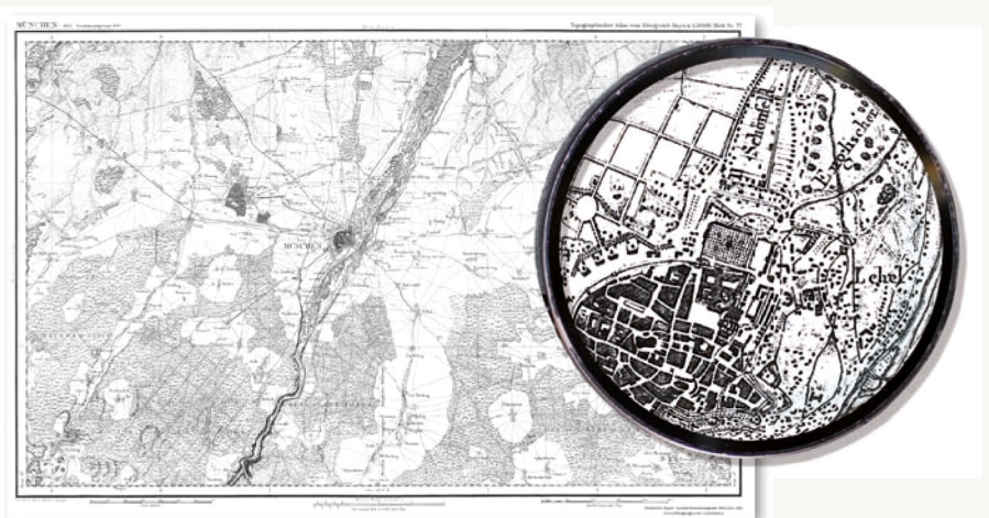
Blatt 77, München 1812

Die ersten Blätter des Topographischen Atlas vom Königreich Bayern 1:50 000, München und Wolfratshausen, sind bereits 1812 erschienen. Im Jahr 1867 lag das Kartenwerk in seiner ersten Ausführung vollständig für das ganze Land vor.